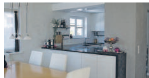
Atelier B&B AG – Seite 11