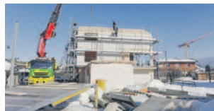
Bildreport – Seite 7