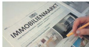
Immobilien – Seite 12, 13