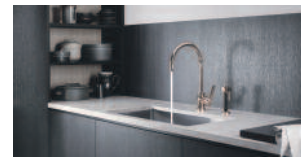
Dornbracht – Seite 19