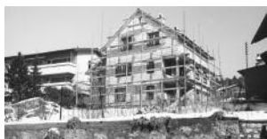
Vor 30 Jahren – Seite 3